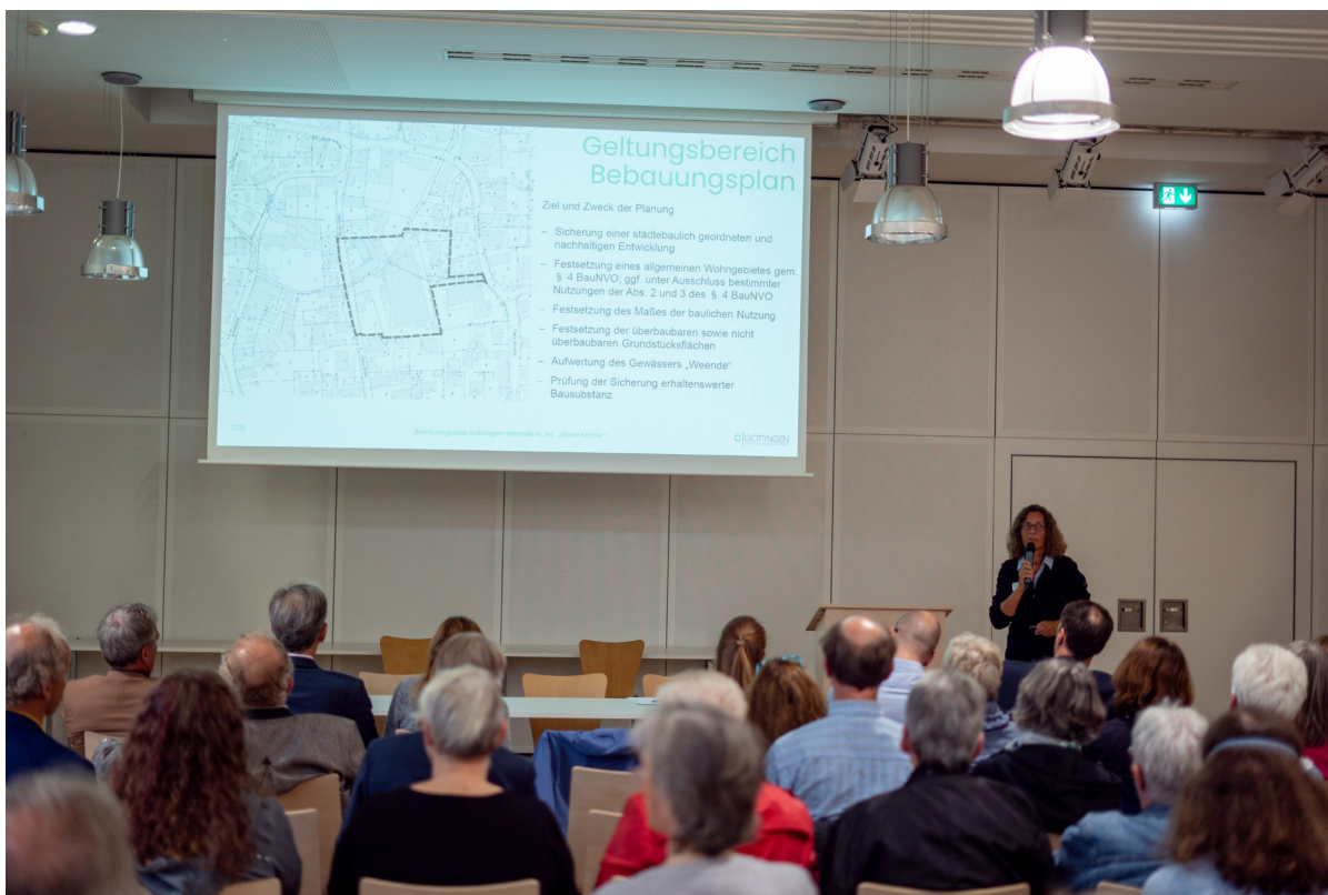
Abb. 04 Auskunft zum Bebauungsplanverfahren durch den Fachdienst Stadtplanung, Stadt Göttingen