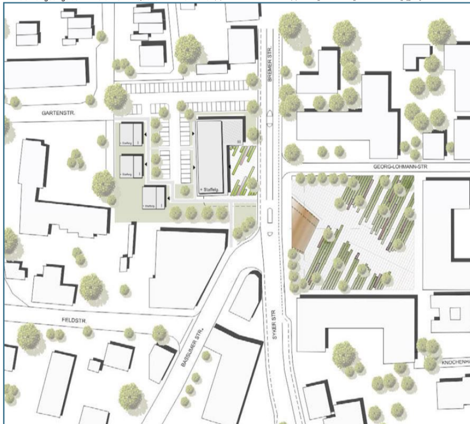
Rahmenplan, Stand Februar 2017

*Entfernungsangaben in Luftlinie / ** Quelle: IHK Hannover ( http://www.fee-ihk-hannover.de/web/index.php?rubrik=sta_details&rubrik=sta_kaufkraft&stadt=40000&mg_samtgemeinde=0&refer=radlink )